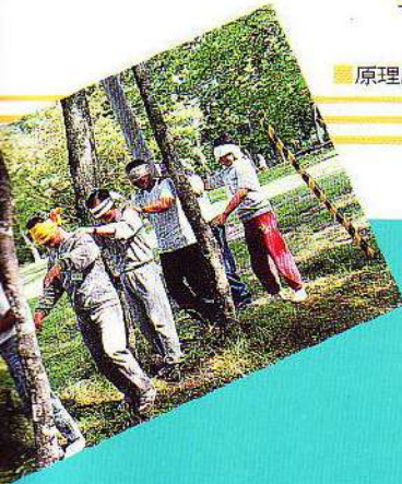
原理原則にもとって、感性と理論を体得するための合宿研修。