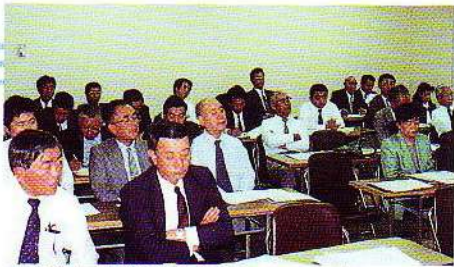
当協会の顧問弁護士、税理士、司法書士、 土地家屋調査士等の専門家による研修。