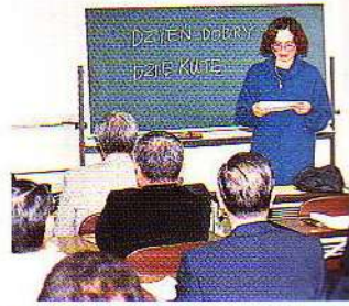
諸外国の講師を招いて国際感覚

札幌不動産リスティング協会は、昭和40年1月にロスアンゼルス不動産協会のマルチプルリスティング方式(共同斡旋契約)を参考にして設立されました。それ以来激動の波にもまれながらも地道な活動を続け、着実に発展してきました。時代のニーズに応える不動産経営集団を目指して、教育・研修にも力を入れてきました。