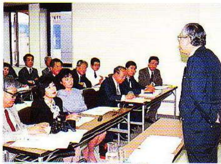
異業種の経営者による経営セミナー、 経済アナリストの講演。